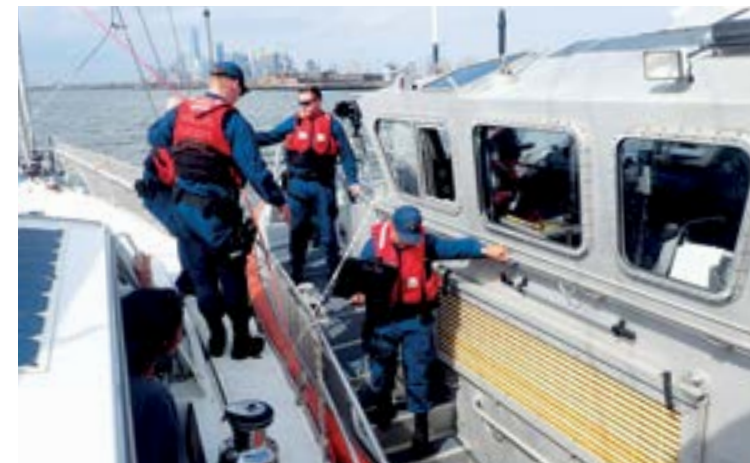
Kontrola pobřežní stráže

Z ničeho nic vedle mě pluje velký člun pobřežní stráže a kapitán mi naznačuje, že přiřazuje k pravoboku. Znovu přeskočím na palubu tři vojáci a začíná další kontrola. Jeden zřejmě projde loď a další dva se věnují dokladům. Papíry od lodě i pasy jsou v pořádku, ale nelíbí se jim můj doklad z celnice z Jacksonville. „Kde máš cruising permit? Tohle je doklad o přihlášení, ale musíš mít ještě jiný,“ ptají se. „Nevím, jaký jiný, tento jsem dostal na celnici a řekli mi, že se s tímto papírem musím přihlásit zde v New Yorku,“ odpovídám. Nějakou dobu se mezi sebou radí, nakonec si papír vyžádá velitel na člunu, který telefonuje na celnici a vše si ověřuje. Jenže to vše trvá velmi dlouho, takže musím zpomalit, abych nepřešel sochu Svobody. Celkem po 40 minutách spoluplavby dostanu zpět svůj papír se slovy: „S tímto dokladem se již nemusíš hlásit zde na celnici, ale po zakotvení se musíš ohlásit na toto telefonní číslo,“ vysvětluje mi velitel pobřežní stráže. Tak to jsem samozřejmě rád, že bude vše jednodušší, ale již nejsem rád, že jsem se takto zdržel a krásně modrá obloha se zatáhla, fotky před sochou Svobody budou nic moc.