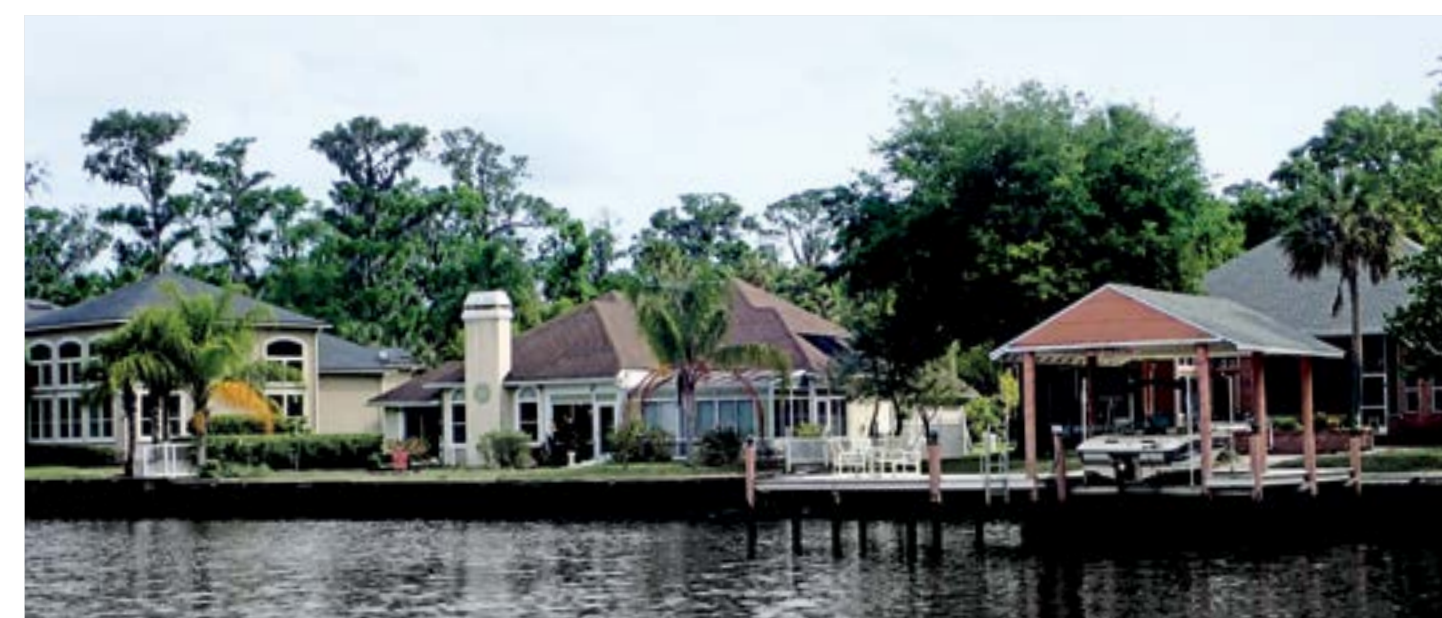
Umělý kanál na Floridě

mraku mám natočeno 180 mil a opět zapluji dovnitř, protože v noci se vítr opět otočí. Tentokrát vplouvám na řeku širokou asi 500 metrů, takže není problém zakotvit u břehu. Ráno je i zde cítit silný protivítr, a tak pokračuji opět vnitřním kanálem 30 mil do Charlestownu. Cestou mě zkontroluje člun pobřežní stráže, kdy za plavby ke mně přeskóčí dva vojáci a prohlédnou doklady. Tato kontrola byla velmi rychlá a bez problémů. Pouze při otázce, kam pluji, odpovím: „Pokračuji dál, v Charlestownu nebudu vůbec stavět.“ Možná by mě potom chtěli kontrolovat, zda se půjdu přihlásit. Jenže tam je hned na kraji marina s pumpou, kde zastavím. Sice mám nafty ještě dost