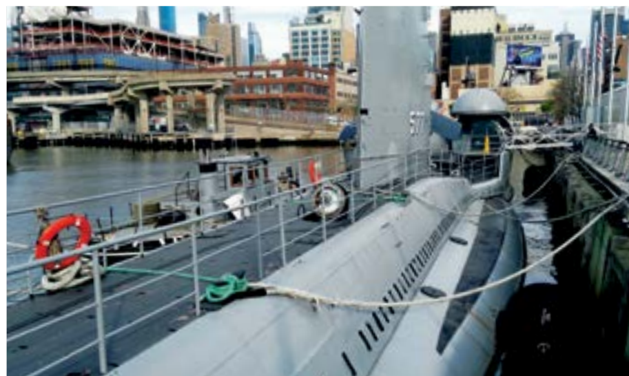
Ponorka v muzeu Intrepid

Po proplutí Norfolkem jsme již v Chesapeake Bay, kterou bych velmi rád proplul a prozkoumal. Jenže z časových důvodů potřebuji pokračovat na sever a také má v noci přijít opět jihozápadní vítr, který potřebuji na plavbu do New Yorku. Chesapeake kanál označuje vysoký most, pod kterým již točím