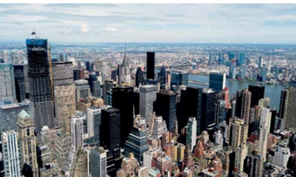
Pohled z Empire State Building