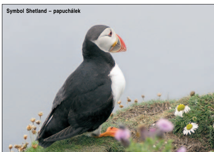
Symbol Shetland – papuchálek

Ráno vyplouváme za větru o síle 25 uzlů a silného deště. Po 3 hodinách však vítr přestává foukat a opět je hustá mlha, takže přichází na řadu motor. Až teprve 10 mil před Orkneji se mlha rozplývá a začíná opět foukat, takže můžeme pokračovat na plachty. Do souostroví Orkneje vplouváme mezi ostrovy