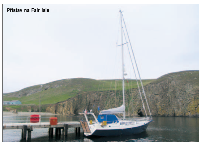
Přístav na Fair Isle